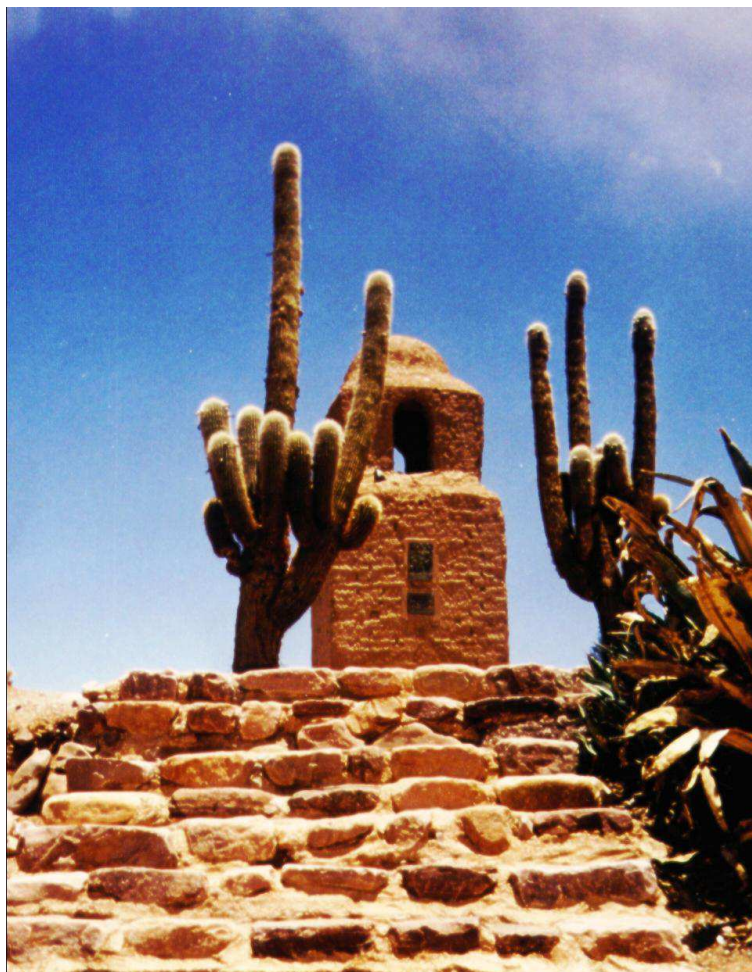
Mirador, Humahuaca (Provincia de Jujuy)